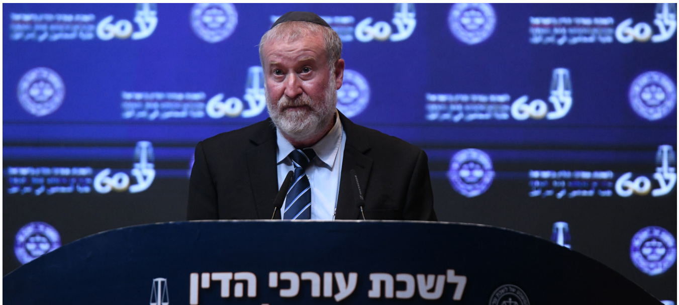
ב-60 שנות קיומה הציבה לשכת עורכי הדין אידיאל גבוה של הגנה על שלטון החוק, היועמ"ש בוועידת המשפט, ספטמבר 2021

באדן חשוב ויציב בבסיס הדמוקרטיה". בית המשפט העליון, אשר קיבל את בקשת ההצטרפות של הלשכה להליך, עמד על חשיבות ההגנה על זכותם של נחקרים לפרטיות ועל הקפדה מצד רשויות החקירה לפעול בהתאם להוראות הדין במסגרת פעולותיהן (בש"פ 7919/19 אוריך ואח' נ' מדינת ישראל).